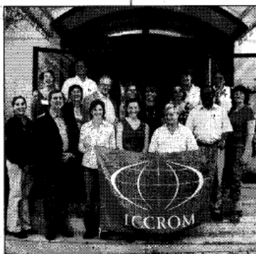
Il gruppo internazionale di esperti