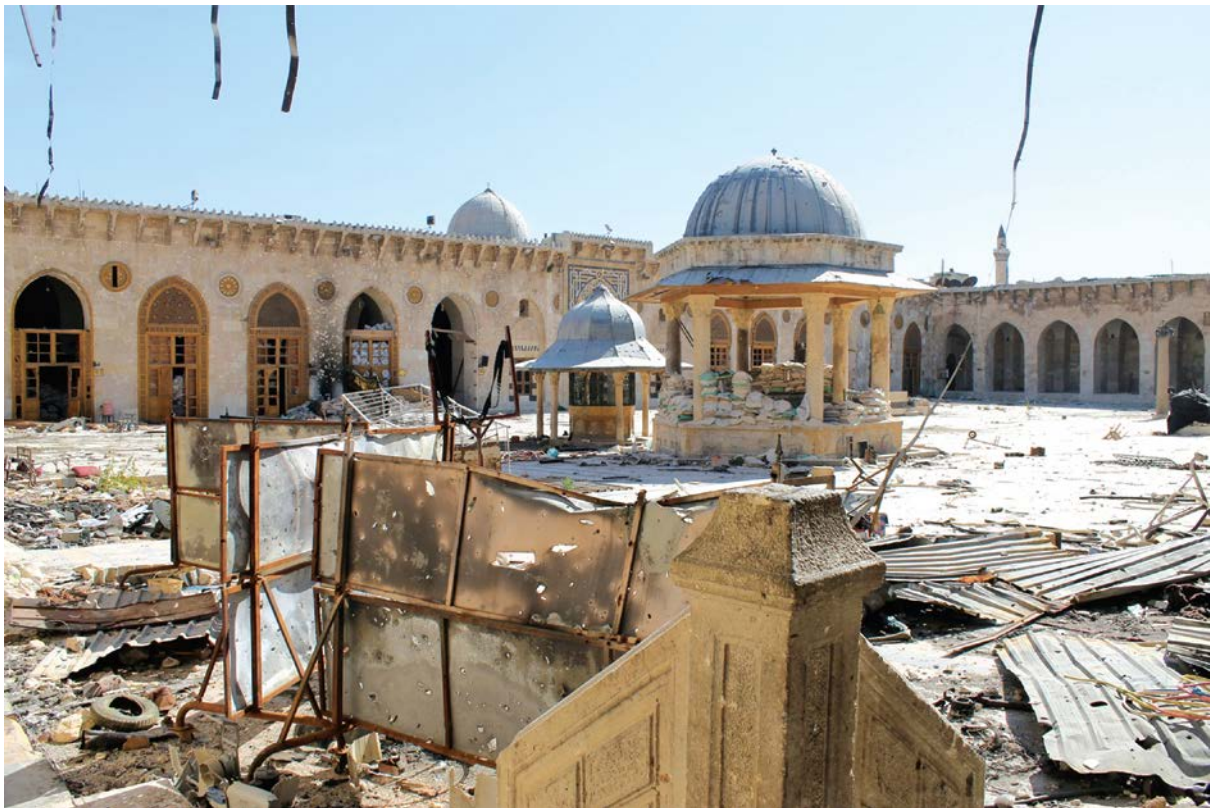
Alep, la mosquée des Omeyyades, 2013