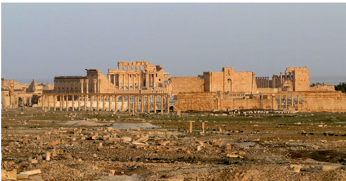
Palmyre, temple de Bel

Renseignements et réservations au 03 21 18 62 62.