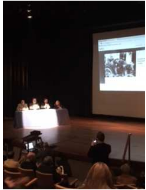
Apertura con autoridades